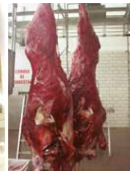
Contusión generalizada de la canal debido a que el animal está echado en el interior del camión.