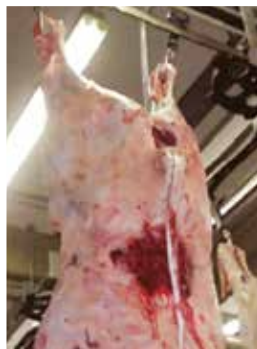
Contusión localizada en la canal debido a un golpe en el lomo del animal.

Para reducir los hematomas y, por consiguiente, las pérdidas, también se recomienda un manejo que preserve el bienestar del animal en las propiedades, con la sustitución de los objetos antes mencionados por banderas y la reducción del uso de picanas eléctricas, realizando un embarque tranquilo y adecuado.