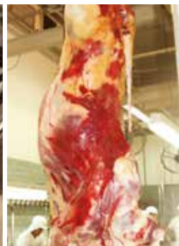
Contusiones generalizadas en la canal debido a un mal manejo durante el período previo a la faena.