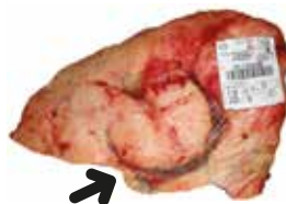
Marca del ganadero en la carne del animal.