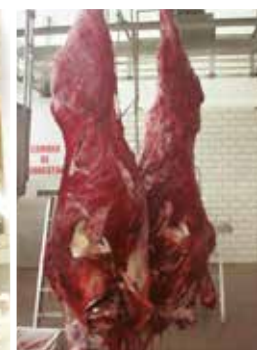
Contusão generalizada na carcaça, animal deitado dentro do caminhão.