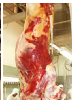
Contusão generalizada na carcaça devido ao mau manejo durante o pré-abate.