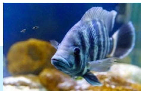
Figura 2 Substratos para tilápias