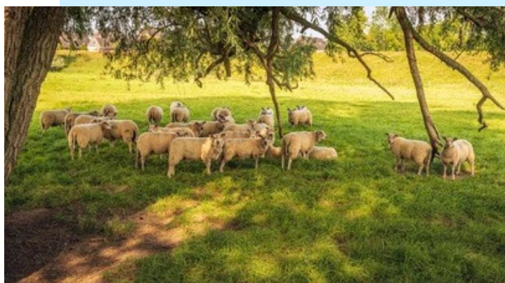
Figura 1 Sombra natural para ovinos