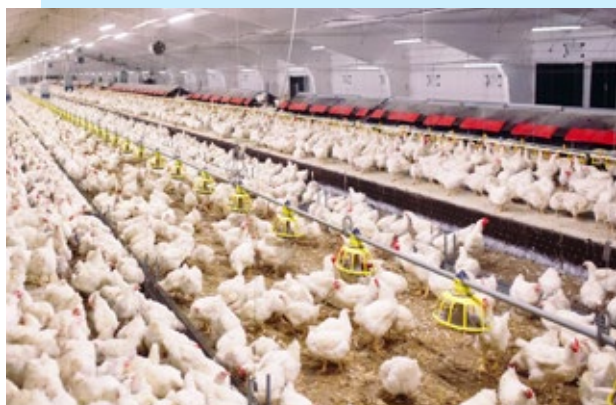
Figura 2 Frangos com acesso a plataformas