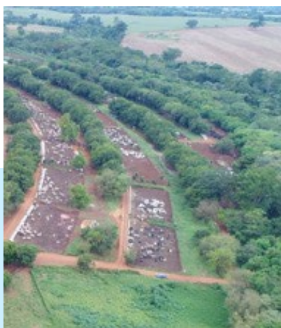
Figura 1 - Confinamento com sombreamento natural

Em confinamentos, uma alternativa de enriquecimento ambiental é a presença de escovas (Figura 2), pois estimula comportamentos de autocuidado nos animais, além de diminuir incidência de comportamentos agressivos e anormais.