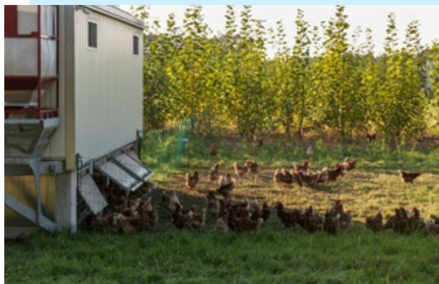
Figura 1 Galinhas com acesso à área externa