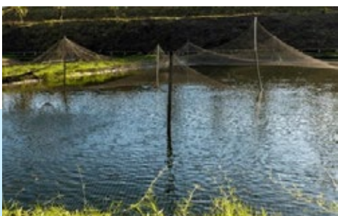
Figura 1 Cobertura de criadouros de peixes

A oferta de enriquecimento para esses animais estimulam expressão de comportamentos que são naturais da espécie, diminuem interações agressivas e respostas de estresse às rotinas de manejo, assim como também podem estimular atividade, consumo de ração e melhorar as taxas de crescimento.