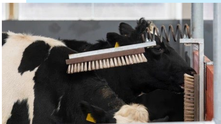
Figura 1 Escovas para vacas de leite