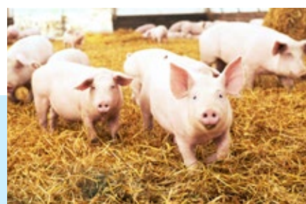
Figura 1 - Animais com acesso à cama de palha