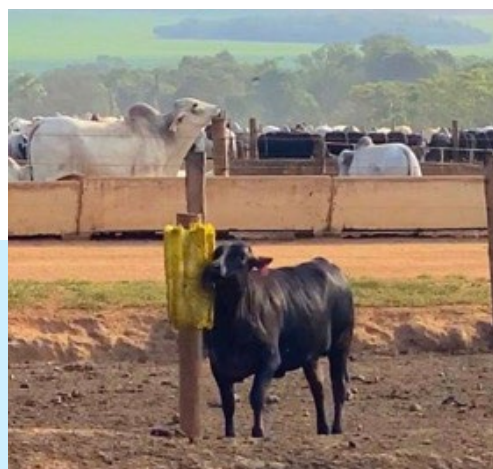
Figura 2 e 3 - Escovas para bovinos