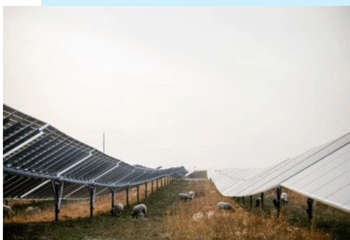
Figura 2 Sombra artificial usando painéis solares para ovinos