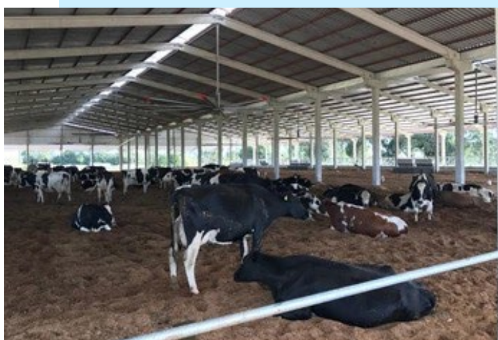
Figura 2 Cama e ventiladores para bovinos de leite